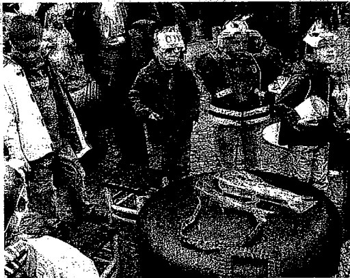
Les spécialistes du recyclage ont informé les enfants.

ment des déchets ». Les organisateurs espèrent qu'ainsi le tri et le recyclage auront encore progressé positivement dans les esprits.