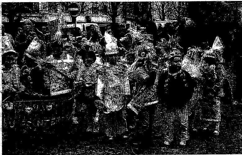
Les enfants ont fait la pub du recyclage.

Organisée à l'échelon national par Éco-emballages, relayée localement par le syndicat de collecte d'ordures ménagères Valdem, très en pointe sur le sujet, la fête du tri et du recyclage continue lundi et mardi