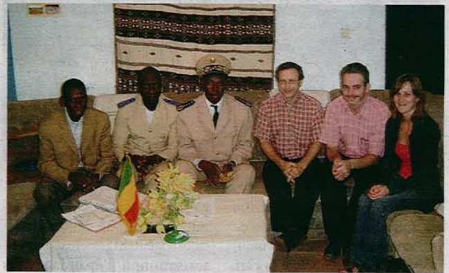
La délégation vendômoise et les responsables de Mopti.

Le syndicat mobilise, par ailleurs, 160.000 € par an (*) pour faire avancer le projet. Et il y a du travail : les Maliens ont, en effet, l'habitude de faire des remblais avec les déchets. A Mopti, la collecte est payante, mais pas obligatoire. La population apporte ses déchets dans des bacs et la mairie