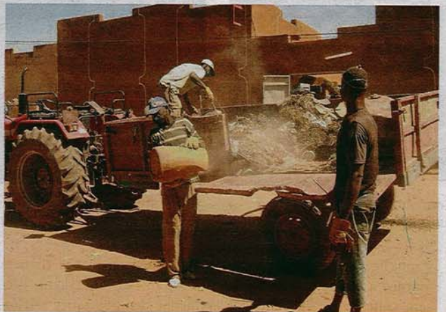
La collecte des ordures ménagères à Mopti.

(*) Val Dem n'apporte pas 160.000 €, mais mobilise des crédits auprès de divers organismes, dont l'agence de bassin.